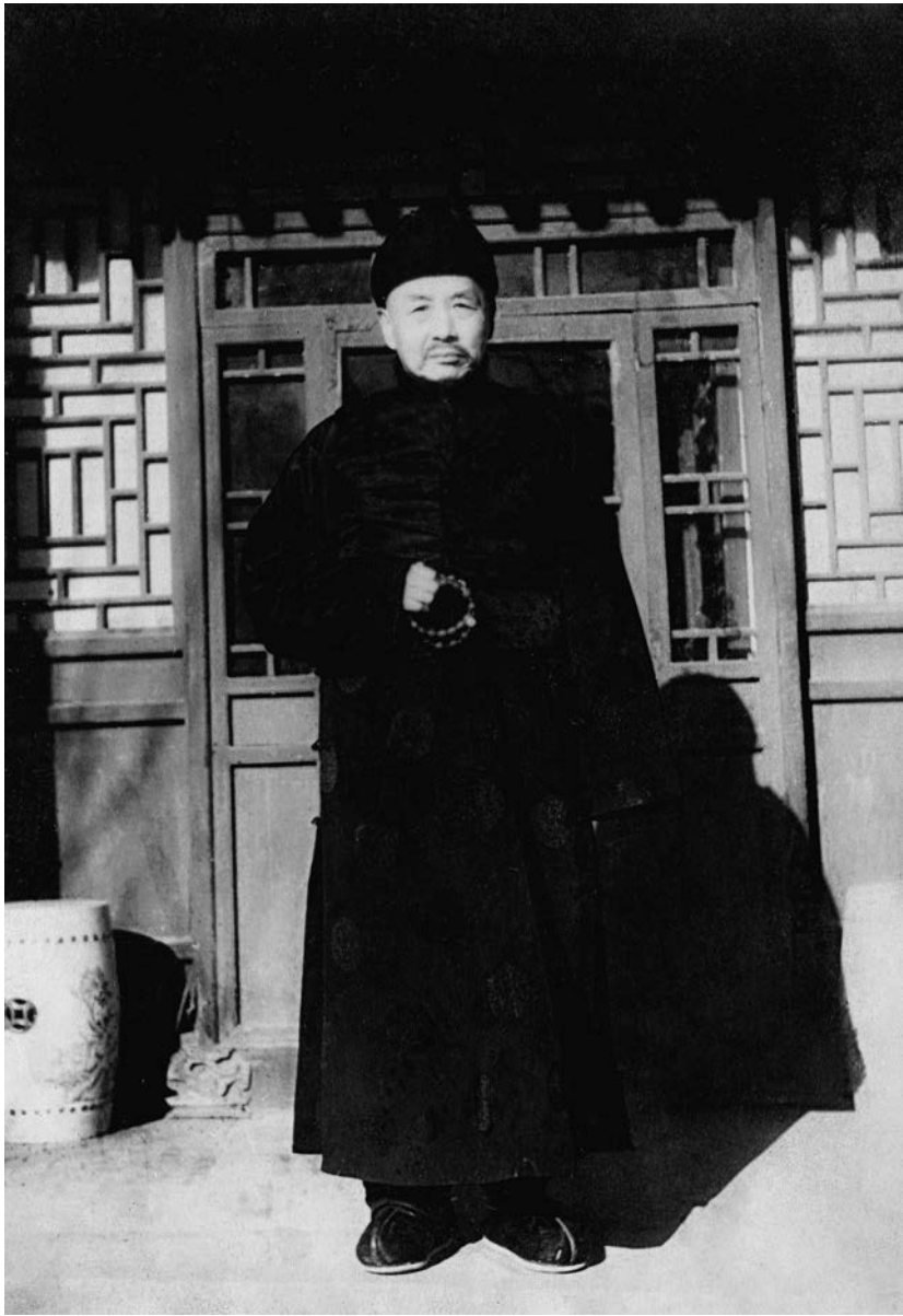
蓮公年近八旬攝於帽兒胡同舊宅