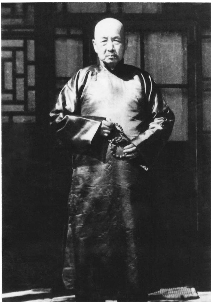
蓮公七十壽誕攝於北京南羅鼓巷帽兒胡同